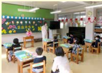
十津川第一小学校