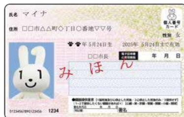
個人番号カード（プラスチック製・写真あり）