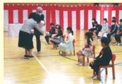
十津川第二小学校